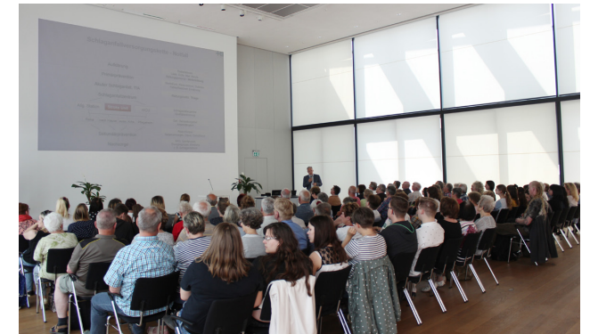
Der Schlaganfalltag lockt viele Besucher in den Bürgersaal.