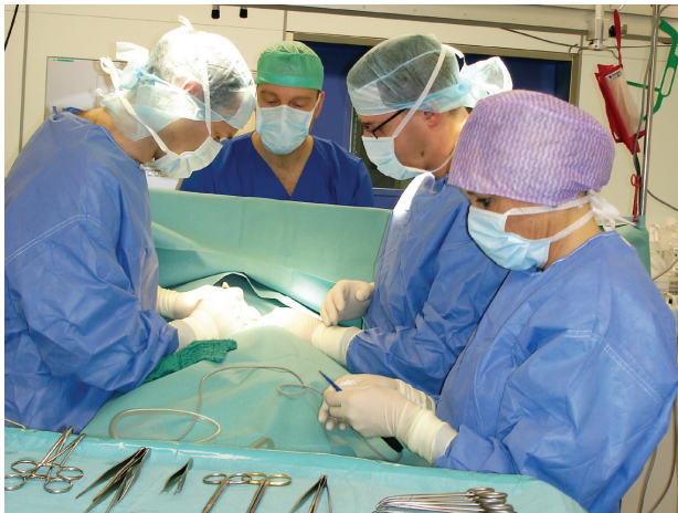
Operation als häufigste Behandlungsmethode